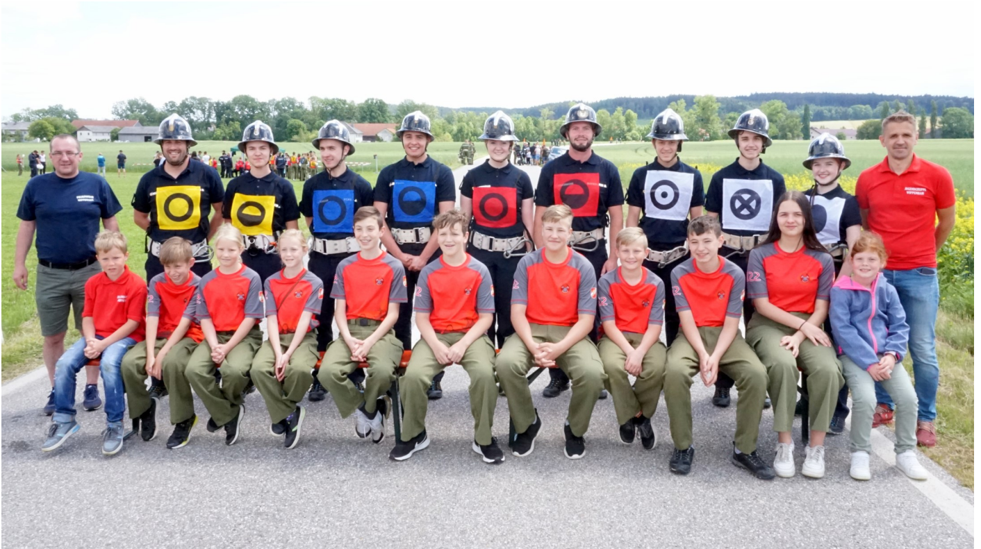
Die Bewerbs- und Jugendgruppe der FF Wippenham 2022